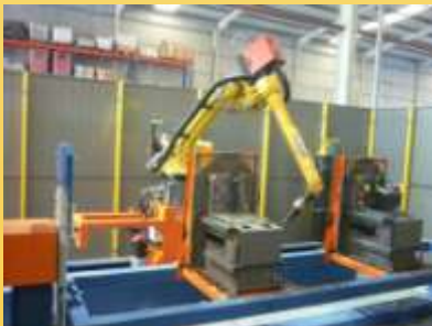
Robot de soldadura