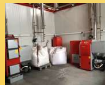
Laboratorio de ensayos