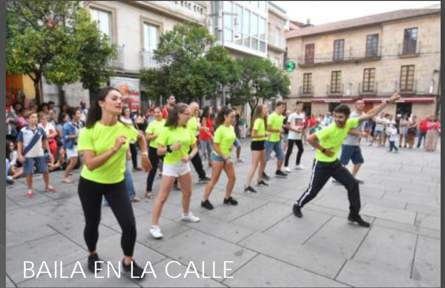
BAILA EN LA CALLE