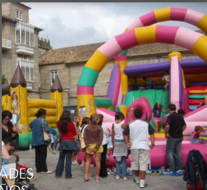
ACTIVIDADES PARA NIÑOS