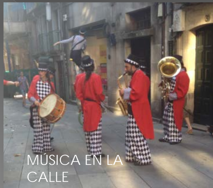
MÚSICA EN LA CALLE