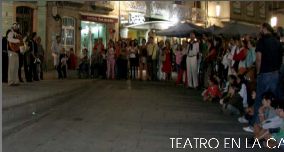
TEATRO EN LA CALLE