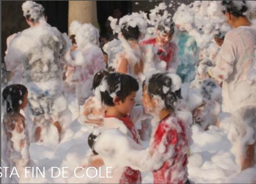
FIESTA FIN DE COLE