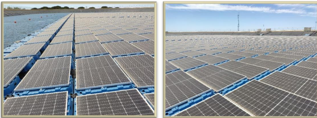
Image 2: Detalle de la instalación fotovoltaica flotante