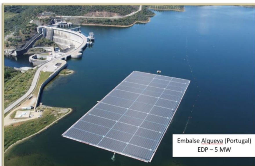
Image 3: Ejemplo de otra instalación fotovoltaica flotante en Portugal