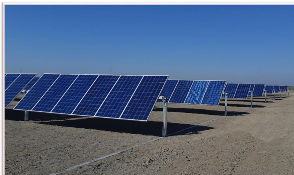
Imagen 2: Fuente de energía usada en la planta